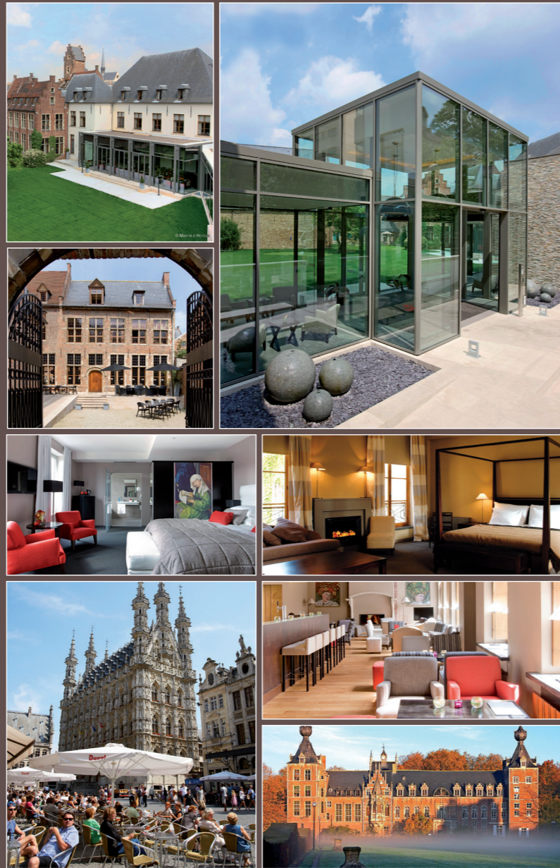
3 Meeting Rooms (up to 100 guests) and 2 Banquet & Event Rooms (up to 120 guests) 103 Guest Rooms & Suites • Bar • Terrace & Garden • Parking

Leuven, universiteitsstad bij uitstek, is krekel én mier: aanleg voor handel, verslingerd op 'n goede maaltijd, tegelijk bezeten van kennis en kwistig met festiviteiten. Van animatie op de Grote Markt tot het onthaal in het Begijnhof: een fabelachtig palet sensaties om van te genieten!